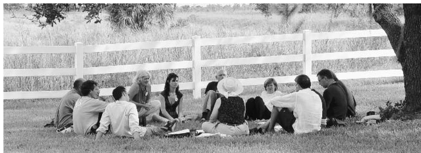
Создание системы убеждений типа «четыре».

Системы убеждений типа «один», «два» и «три» в различной степени отражают незнание о существовании систем убеждений типа «четыре». Системы убеждений типа «четыре» устанавливают правила и игровые поля для других типов.